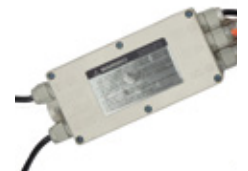
Caja SUMA ABS