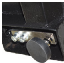
Pies regulables y célula de acero niquelado IP66