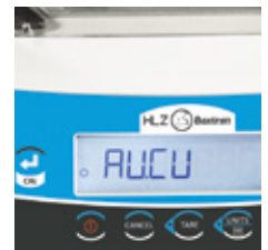
Guía de menú en pantalla