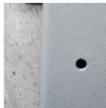
Agujero métrico para fijación chasis superior