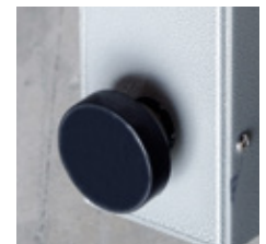
Pies pivotantes en modelo 260625