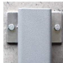
Fijación al suelo mediante pernos de anclaje (no incluido)